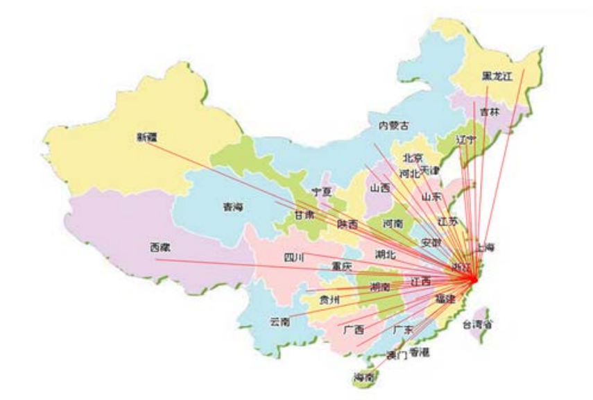
图 3 国内销售网络分布图

式铺路，期间也经历过喜与悲，伤和痛，尤其是机械行业根本就没有参照的模式，经过 2012~2014 年三年时间的摸索和经验的总结，2015 年开始每年以 40% 以上的速度快速递增，2018 年销售额达到人民币 4000 万元，确保了这几年每年 20% 以上的销售额增长。