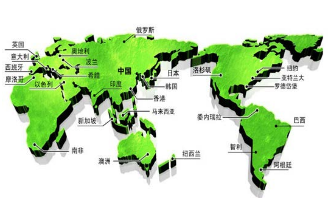
图 4 公司顾客遍布全球